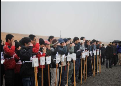
小雨の中も凛々しい選手たち

第54回全日本学生グライダー競技選手権大会の開会式が行われた。雨にもかかわらず、選手の姿は堂々としたものであった。